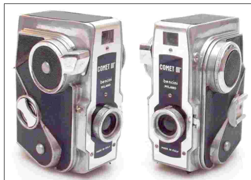
Fig 1 – Comet III con ghiera cilindrica

Nel 1969 iniziò la produzione della COMET 3 che sostituì la Comet III e rispetto a questa presentava un frontale con un disegno completamente diverso