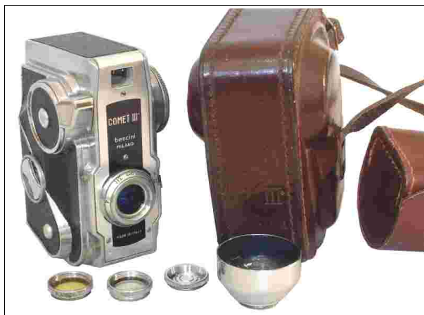
Fig 9 – Comet III con borsa ed accessori

Ciò nonostante probabilmente a causa della curiosa forma questo apparecchio è abbastanza ricercato e non può mancare in una collezione di apparecchi di fabbricazione italiana.