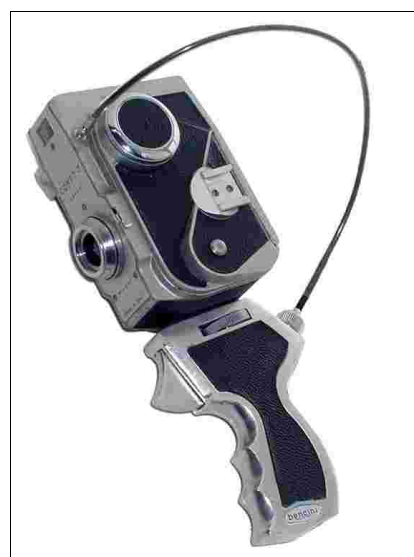
Fig 11 – Comet III con impugnatura a pistola