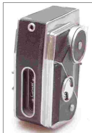
Fig 2 – Comet III vista da dietro