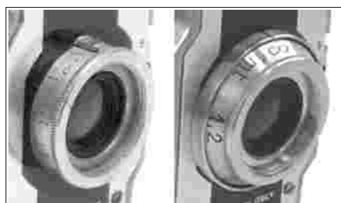
Fig 6 – particolare delle ghiera cilindriche e coniche con scala in metri