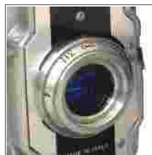
Fig 7 – particolare della ghiera conica con scala in piedi