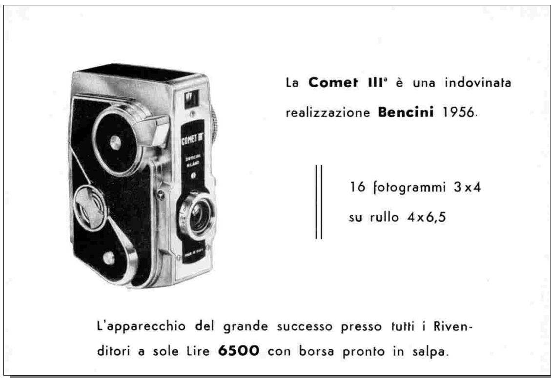
Fig 12 – inserto pubblicitario 1956