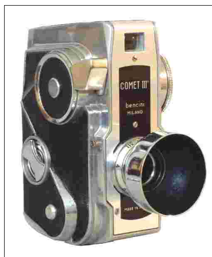
Fig 10 – Comet III con paraluce