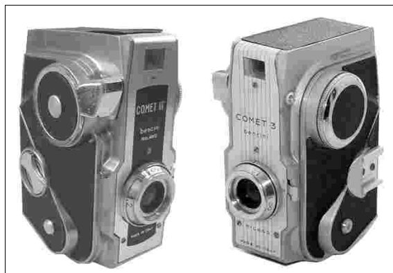
Fig 5 – Comet III con ghiera conica e Comet 3

E' quindi possibile trovare i modelli sopra descritti con scala in metri o con scala in piedi, ciò è valido soprattutto per la seconda variante della Comet III.