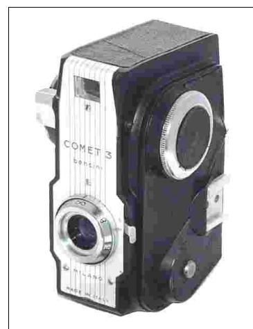
Fig 8 – Comet 3 di colore nero