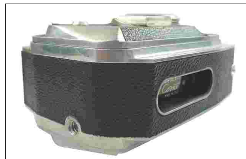
Fig 4 – Comet III vista della parte inferiore